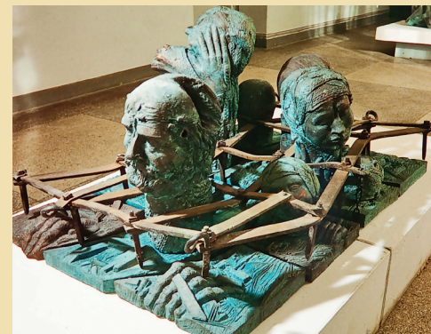
Коллективизация. 1988. Шамот, гальванопластика