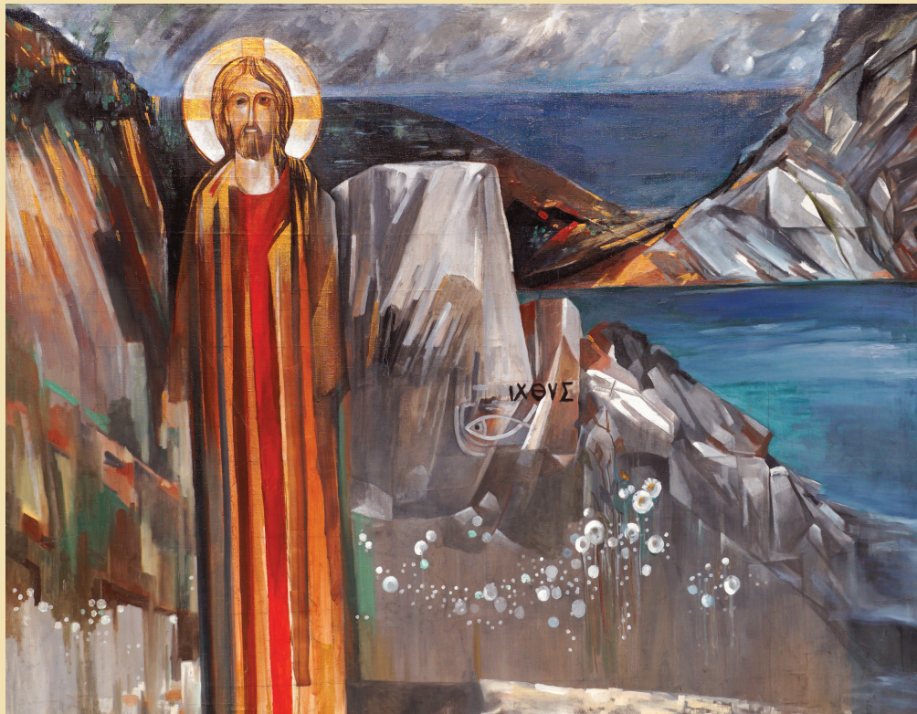
Иисус. Серия «Александровский грабен». 2022. Холст, масло