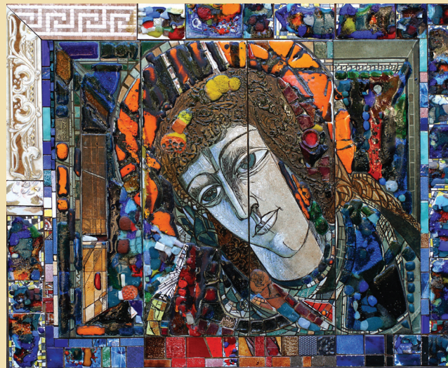
Ангел. 2017. Надглазурная роспись, стекло, смальта, мозаика