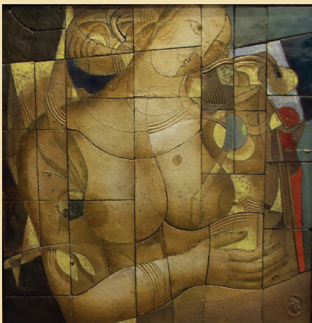
Осенний день. 1995. Шамот, глазури, эмали