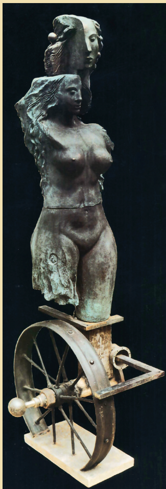
Фортуна. 1990. Шамот, гальванопластика, сварной металл