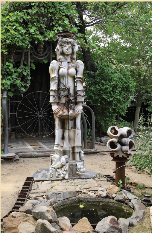
Плодородие. 1986. Шамот, глазури, соли

Эта выставка приурочена к 85-летию со дня рождения Петра Ивановича Чаплыгина (1940—2022) — народного художника Российской Федерации, волгоградского керамиста, скульптора, монументалиста, великого мастера. Большие персональные выставки он готовил к своим круглым датам, всякий раз поражая какой-то новой своей ипостасью и неизменно ошеломляя масштабами сделанного. Это первая выставка Петра Ивановича, на которую он не придет лично. Мы можем попытаться охватить взглядом его свершившуюся судьбу, творческую траекторию, его поиски истины. В случае Петра Чаплыгина искусство и сама его харизматическая личность, его образ связаны неразрывно, и еще неизвестно, что сильнее воздействовало и продолжает влиять на нас.