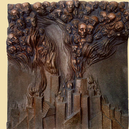
Серый пепел. Из серии «Ни давности, ни забвения». 1984. шамот, глазури