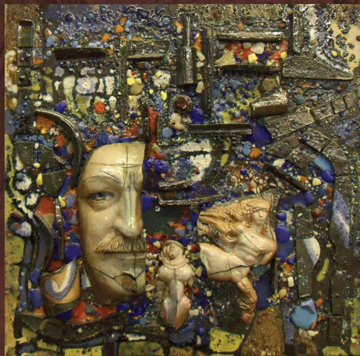
Пристрастие. 2005. Шамот, глазури, соли

Куратор выставки О. П. Малкова