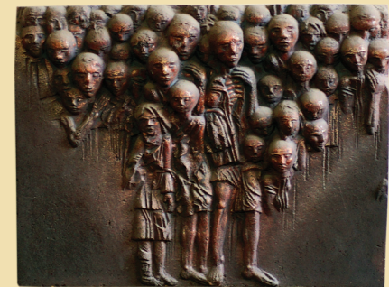
Детский блок. Из серии «Ни давности, ни забвения». 1984. шамот, глазури