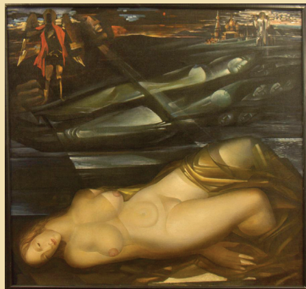
Вечность. 1995. Холст, масло.