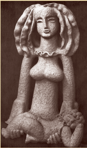
Материнство. 1970-е. Шамот, глазури, соли.