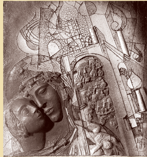
Видение во храме. Серия «Форма и цвет». 1990