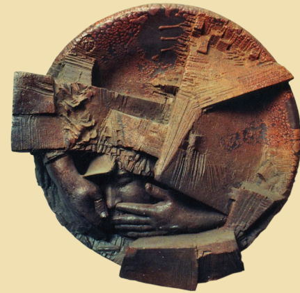
Без вести пропавший. 1980-е. Шамот, глазури