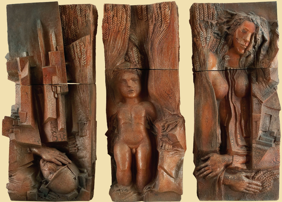
Хлеб войны. Триптих. 1985. Шамот, глазури