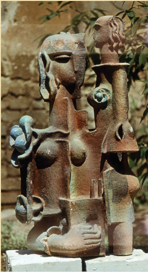
Разговор. 1970-е. Шамот, глазури, соли