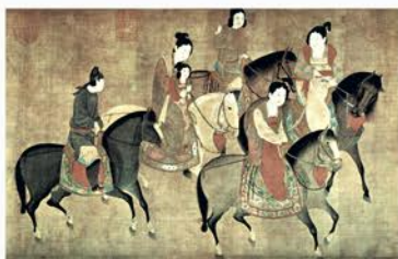
1. Др. Китая